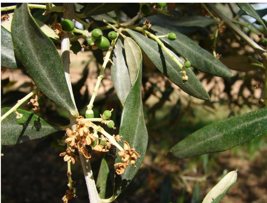
Detall de la fulla de la varietat 'Tiuranenca'