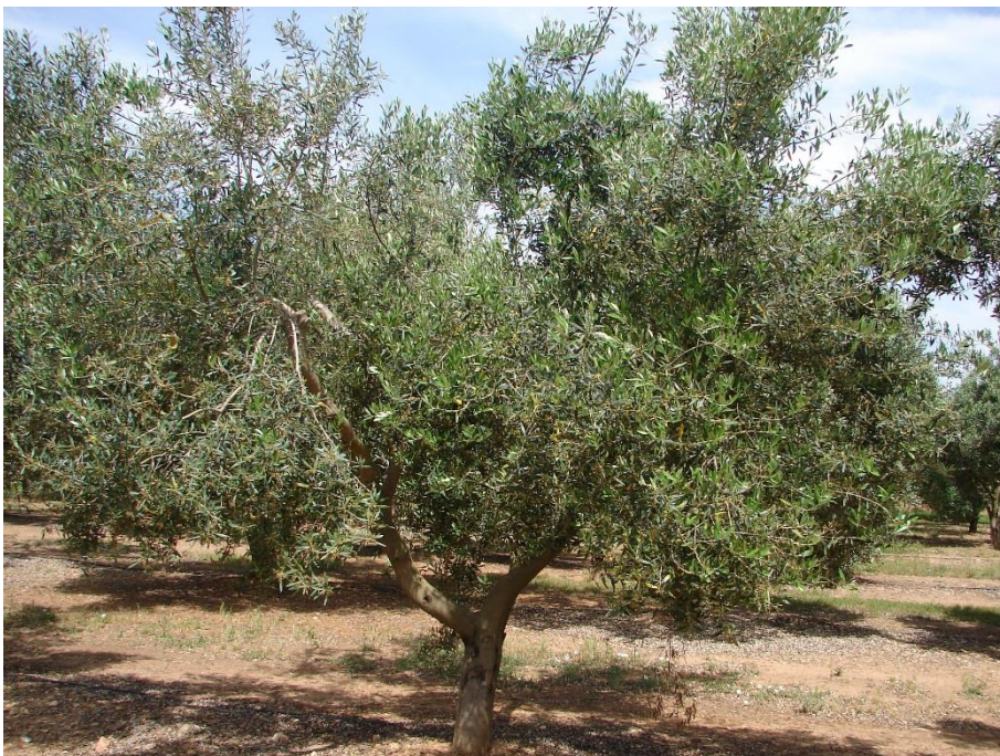
Exemplar de la varietat 'Tiuranenca' de 15 anys