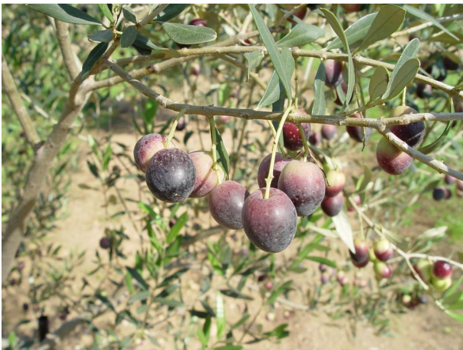
Detall del fruit de la varietat 'Tiuranenca'