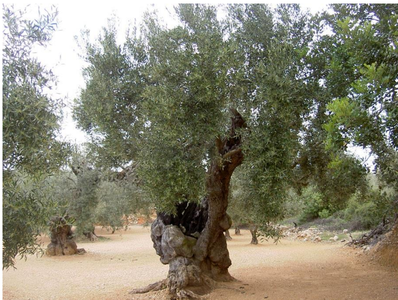
Exemplar d'olivera monumental de la varietat 'Carrasquenya'