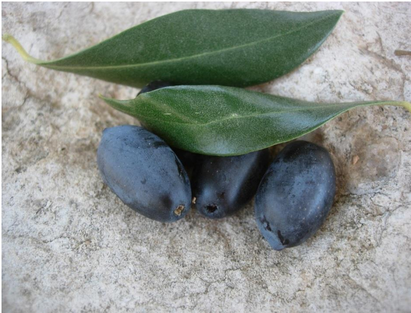
Detall del fruit i fulla de la varietat 'Carrasquenya'