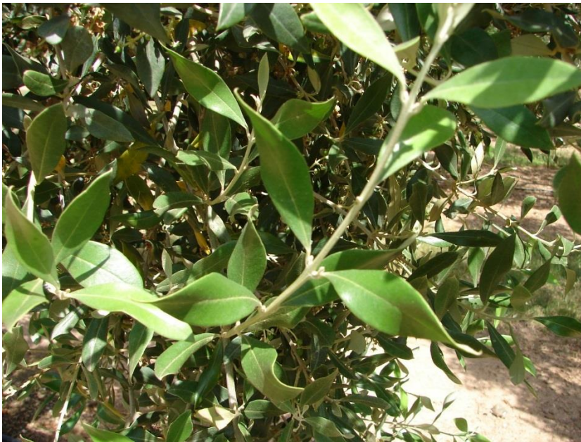
Detall de la fulla de curvatura helicoidal del limbe